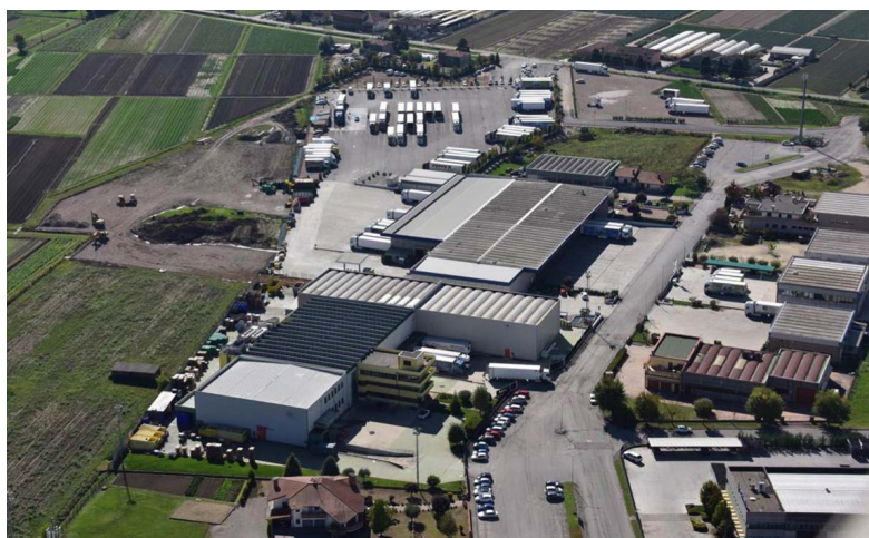
Agricola Lusiana vista dall'alto

Agricola Lusiana, come uno dei più qualificati fornitori italiani specializzati nella fornitura alla GDO di agrumi, offre un servizio di qualità e un ottimo value for money dei suoi prodotti, garantito dall'esperienza costruita in tre generazioni, che ha permesso di costruire solidi rapporti di partnership con i migliori produttori mondiali, riuscendo così ad